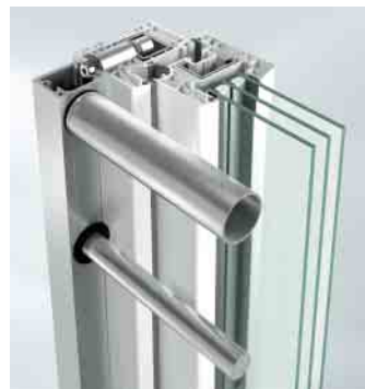
Befestigung mit Profildübel

Stangenvariante Durchmesser von 12 bis 35 mm