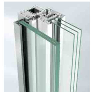
Befestigung mit Falzleiste

Stangenvariante Durchmesser von 12 bis 35 mm