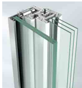
Befestigung mit Profildübel

Glasvariante Glasstärken von 10 bis 16 mm