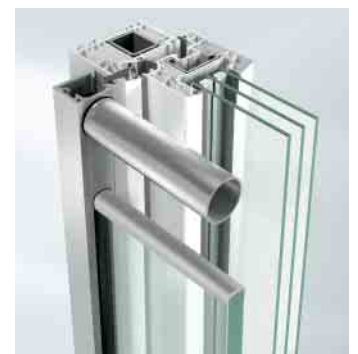
Befestigung mit Falzleiste